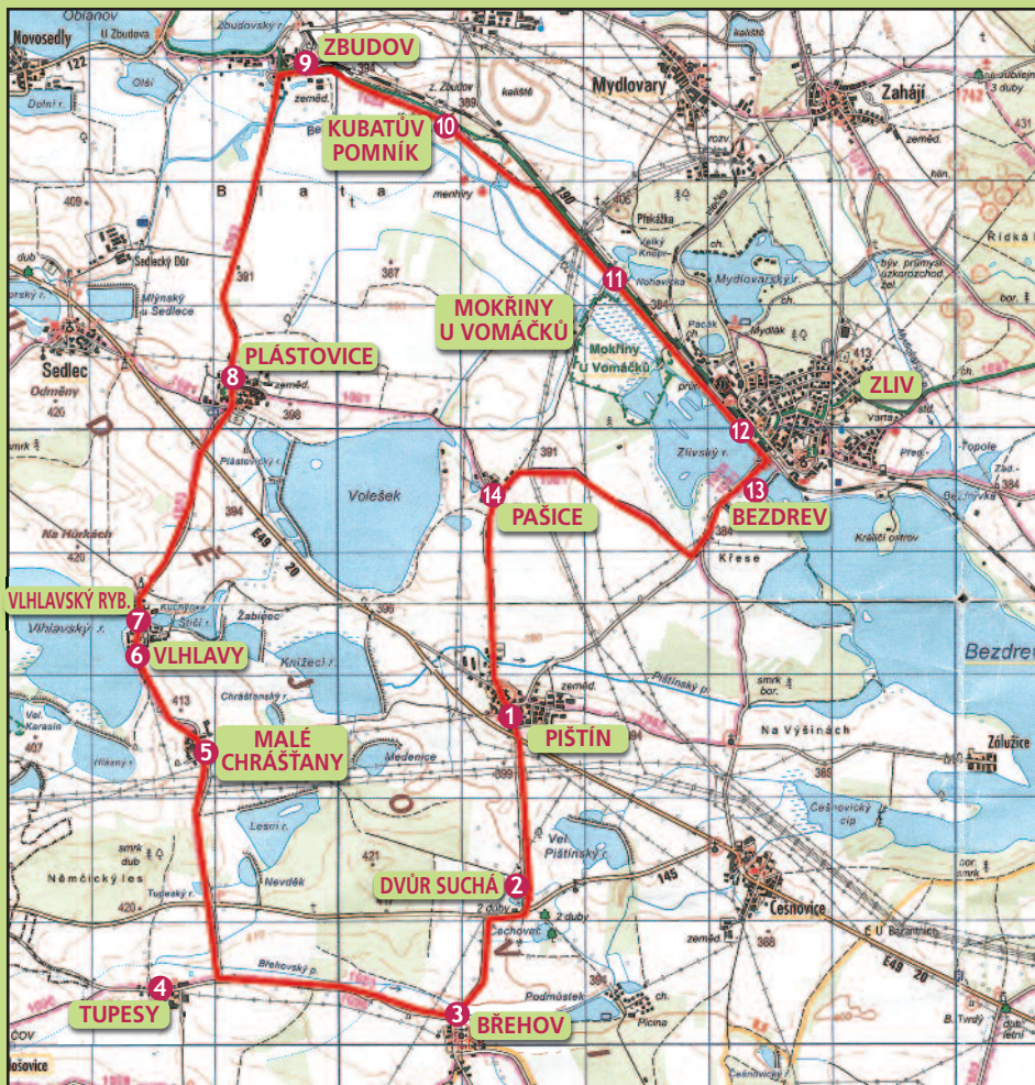
Mapové podklady zpracovány s využitím Interaktivních map www.masozkvet.cz